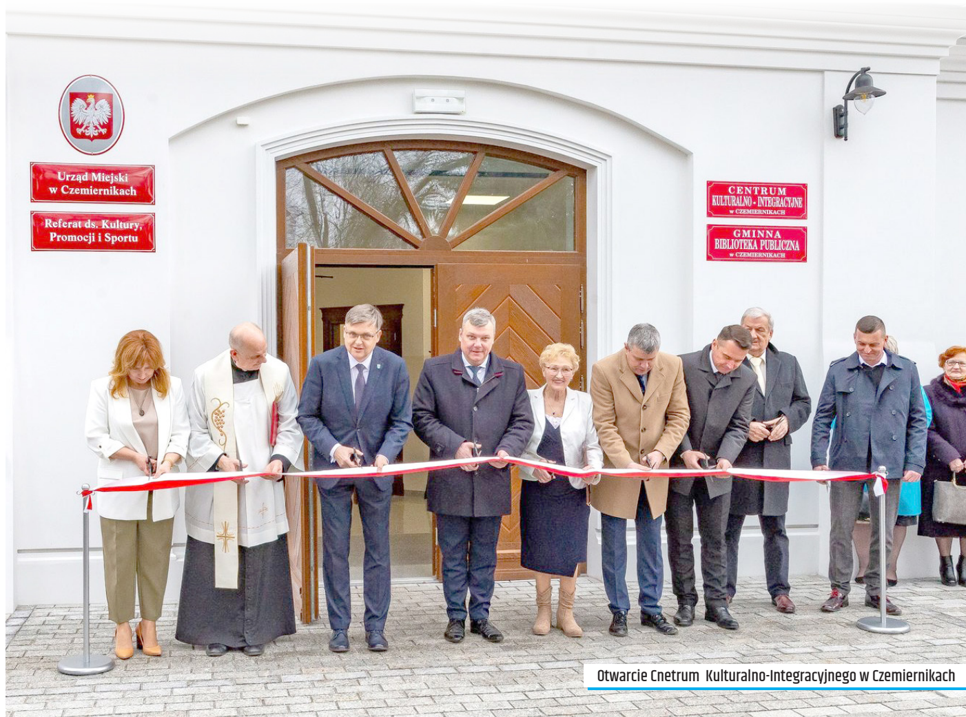
Otwarcie Centrum Kulturalno-Integracyjnego w Czemiernikach

Z okazji Świąt Wielkanocnych składamy Państwu najserdeczniejsze życzenia zdrowia, pogody ducha i wzajemnej życzliwości. Niech Zmartwychwstały Chrystus napelni wszystkich swoimi łaskami, da siłę do pokonywania trudności, obdarzy wiarą, nadzieją i pokojem. Niech ten szczególny okres będzie czasem zadumy, wyciszenia i wypoczynku. Radosnego Alleluja